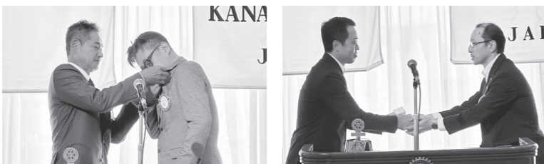
井上会長から能登新会長へ