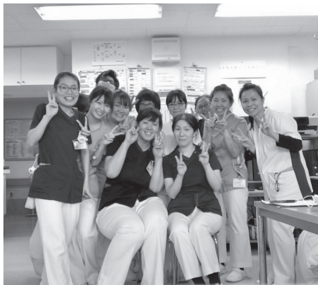
看護師時代の私(左端)

し、その後日本で看護師の資格を取得し、6年間看護師として勤務しておりました。最初の4年間は横浜の地域連携型病院の整形外科が勤務先であり、その後富山市の病院へ異動し、透析室で2年間勤務しました。