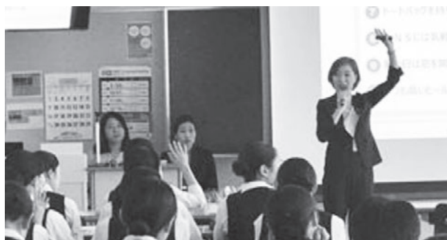
石川県内でのセミナー開催の様子

例えば女性に伝える「安全・安心」として、2007年には当社の女性社員を中心に「セコム・女性の安全委員会」を発足し、女性ならではの視点と安全のプロの立場から、防犯セミナーの開催、防犯に関するウェブサイトの運営、防犯に関する本の監修などを行っています。セミナーは学校や大学、企業などからの要請を受けて開